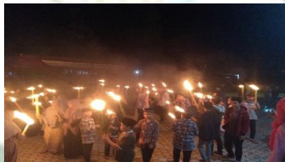
Gambar 6.4 Proses Tawoh yang dihadiri oleh Anak-Anak

Peneliti juga mengamati bahwa upaya mempertahankan tradisi Tawoh tidak hanya dilakukan pada saat pelaksanaan tradisi, tetapi juga dalam kehidupan sehari-hari masyarakat. Peneliti melihat bahwa orang tua secara aktif mengajarkan anak-anak mereka tentang tradisi Tawoh , menceritakan sejarahnya, menjelaskan maknanya, dan mengajak mereka untuk ikut serta dalam pelaksanaan tradisi.