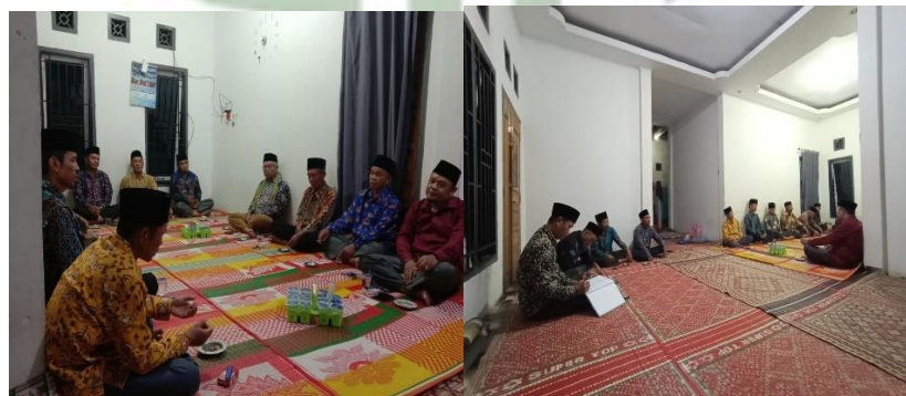
Gambar 3.4 Suasana musyawarah empat jenis di rumah menggong

Berdasarkan hasil observasi yang dilakukan peneliti, kegiatan musyawarah tidak selalu dilaksanakan di satu tempat tetap, melainkan bergiliran di rumah-rumah anggota Empat Jenis, yaitu Depati Nenek Mamak, Alim Ulama, Cerdik Pandai, dan Tokoh Masyarakat . Suasana musyawarah berlangsung penuh kekeluargaan dan keakraban. Para tokoh duduk melingkar di atas tikar pandan, saling bertukar pendapat dengan bahasa yang sopan dan penuh rasa hormat. Pemangku adat berperan sebagai pembuka musyawarah, menjelaskan latar belakang dan pentingnya pelaksanaan tradisi, sedangkan tokoh agama memberikan masukan terkait aspek keagamaan yang akan diterapkan dalam kegiatan tersebut, seperti pembacaan qunut nazilah , doa bersama, dan adab selama pelaksanaan tradisi.