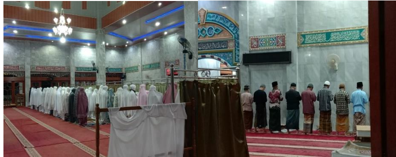
Gambar 4.4 Proses Pembacaan Do'a Qunut Nazilah