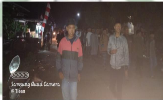
Gambar 5.4 Kegiatan Mengelilingi Desa

Suasana yang tampak dari kegiatan ini sangat religius sekaligus hangat. Zikir bersama menciptakan rasa persaudaraan yang kuat, dan masyarakat tampak begitu khushyuk serta penuh harap. Adapun dari hasil pengamatan, peneliti melihat bahwa kegiatan ini bukan hanya dimaknai sebagai bentuk perlindungan spiritual, tetapi juga memperkuat solidaritas antar warga dalam menghadapi tantangan hidup bersama.