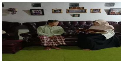
Gambar 7.4 Kesaksian Masyarakat yang merasakan efek

Peneliti juga melakukan wawancara mendalam dengan seorang warga yang mengaku telah merasakan manfaat dari pelaksanaan tradisi Tawoh , dari hasil wawancara tersebut, peneliti memperoleh beragam kisah mengenai pengalaman penyembuhan yang mereka alami. Salah seorang warga menceritakan bahwa dirinya pernah mengalami demam selama beberapa hari, namun kesehatannya pulih tidak lama setelah tradisi Tawoh dilaksanakan, ia juga menambahkan bahwa meskipun pengobatan medis tetap digunakan, penggabungan antara pengobatan medis dan tradisional dianggap penting, karena manusia hanya dapat berikhtiar, sedangkan kesembuhan sepenuhnya merupakan kehendak Allah SWT. Obat Tradisional.