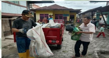
Gambar.1.4 Proses pengambilan sampah masyarakat dari rumah ke rumah

Berdasarkan observasi yang dilakukan peneliti di Desa Semerap, nilai kebersihan yang terkandung dalam tradisi Tawoh masih terlihat jelas dalam kehidupan masyarakat sehari-hari, meskipun tradisi ini terakhir kali dilaksanakan pada tahun 2020. Salah satu bentuk nyata dari pelestarian nilai tersebut adalah adanya masyarakat memiliki kesadaran tinggi dalam melakukan tindakan pencegahan menjaga kebersihan lingkungan sekitar. Selain itu, masyarakat Semerap juga melaksanakan kegiatan kebersihan lingkungan secara teratur. Setiap desa memiliki petugas yang bertugas mengumpulkan sampah dari rumah ke rumah. Kegiatan ini menjadi salah satu bentuk nyata upaya masyarakat dalam menjaga kebersihan dan mencegah timbulnya berbagai penyakit. Hal tersebut juga diperkuat dengan hasil dokumentasi yang tersaji pada gambar di bawah ini.