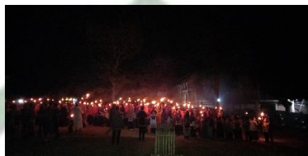
Gambar 2.4 Proses Tawoh

mengikuti setiap rangkaian dengan sikap hormat dan tertib, menunjukkan adanya pemaknaan religius yang kuat di balik kegiatan adat tersebut. Selain itu, suasana kebersamaan yang tercipta selama pelaksanaan tradisi memperlihatkan bahwa nilai-nilai keagamaan tidak hanya diucapkan dalam doa, tetapi juga diwujudkan dalam perilaku saling menghormati, berbagi, dan mempererat tali silaturahmi antar warga.