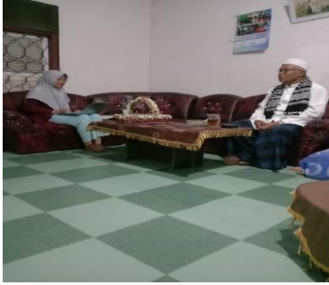
Gambar 1.2 Prosesi Wawancara