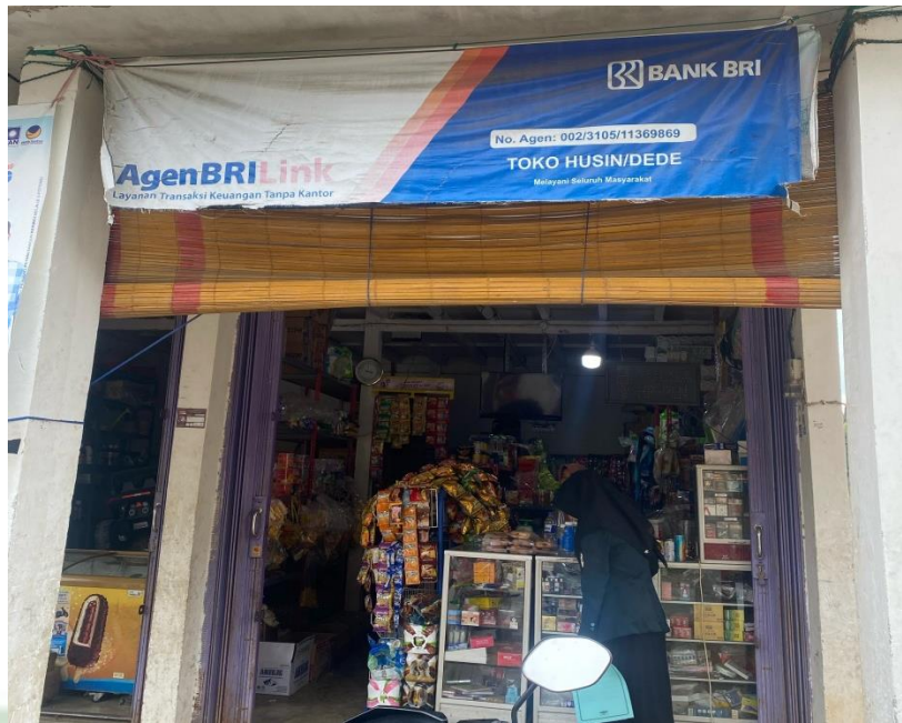
Dokumentasi: Agen BRI Link Husin Dede Desa Tarutung