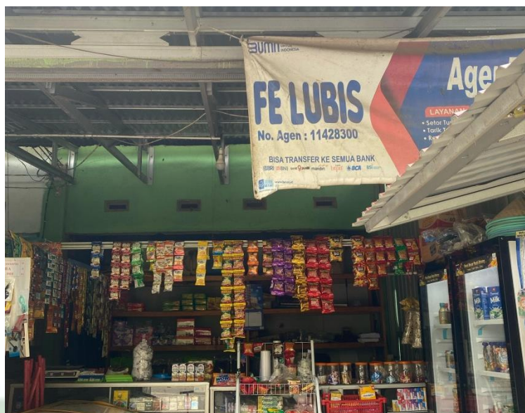
Dokumentasi: Agen BRI Link FE Lubis Desa Pulau Sangkar