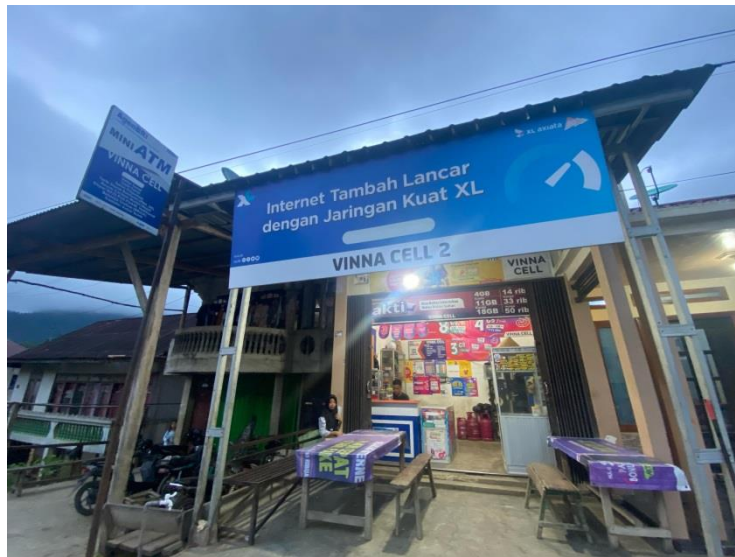
Dokumentasi: Agen BRI Link Vina Cell Desa Tarutung