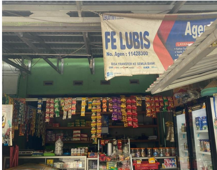
Dokumentasi: Agen BRI Link FE Lubis Desa Pulau Sangkar