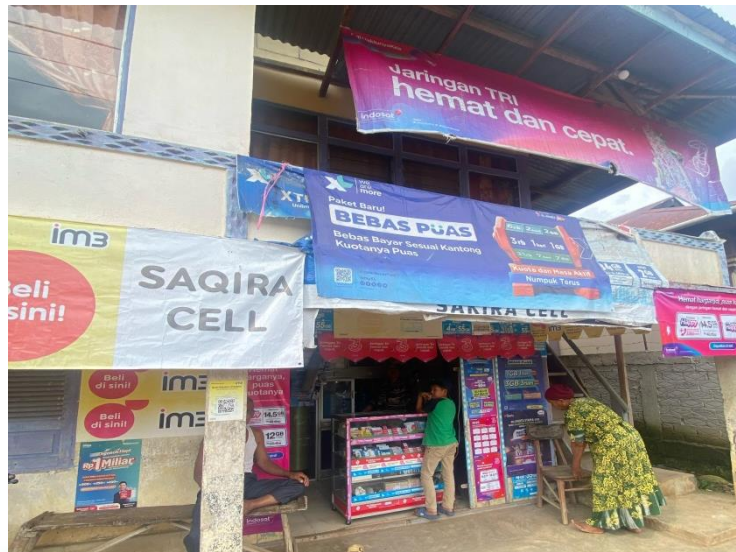
Dokumentasi: Agen BRI Link Sakira Desa Tarutung