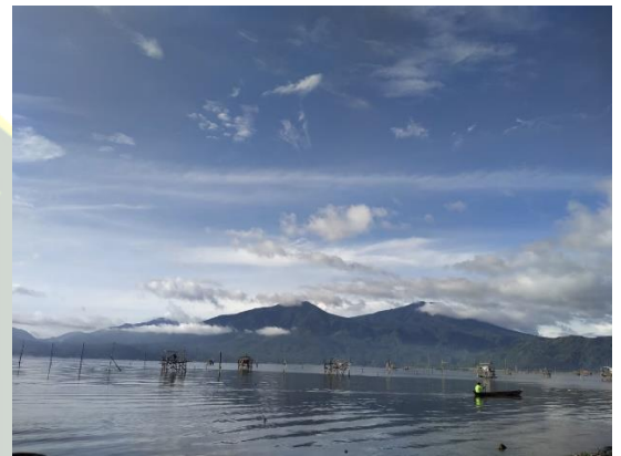
Wisata Danau Tanjung Tanah