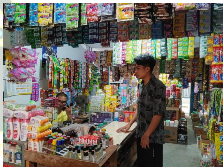
UMKM Tanjung Tanah