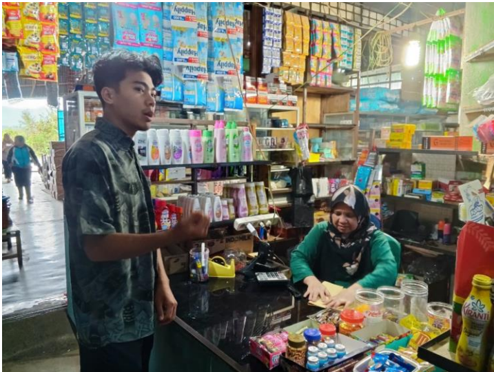
UMKM Tanjung Tanah