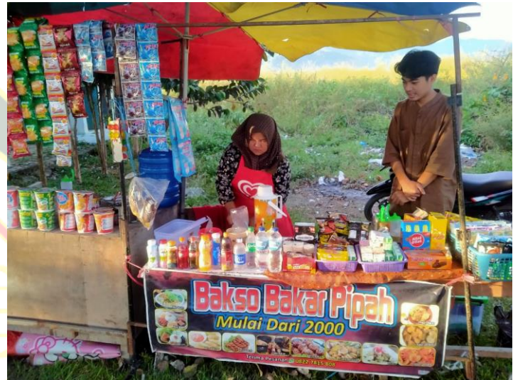
UMKM Tanjung Tanah