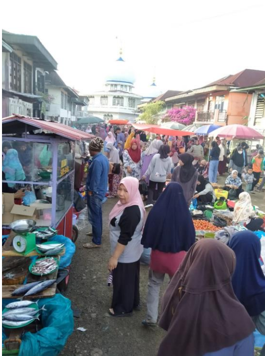
UMKM Tanjung Tanah