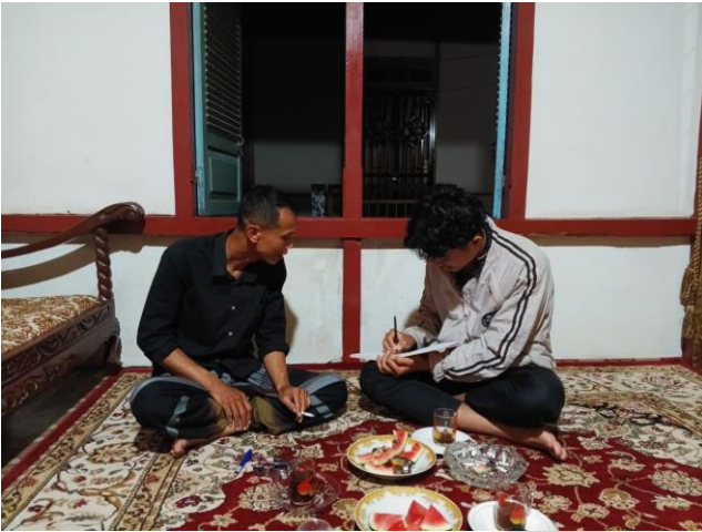
Kepala Desa Tanjung Tanah