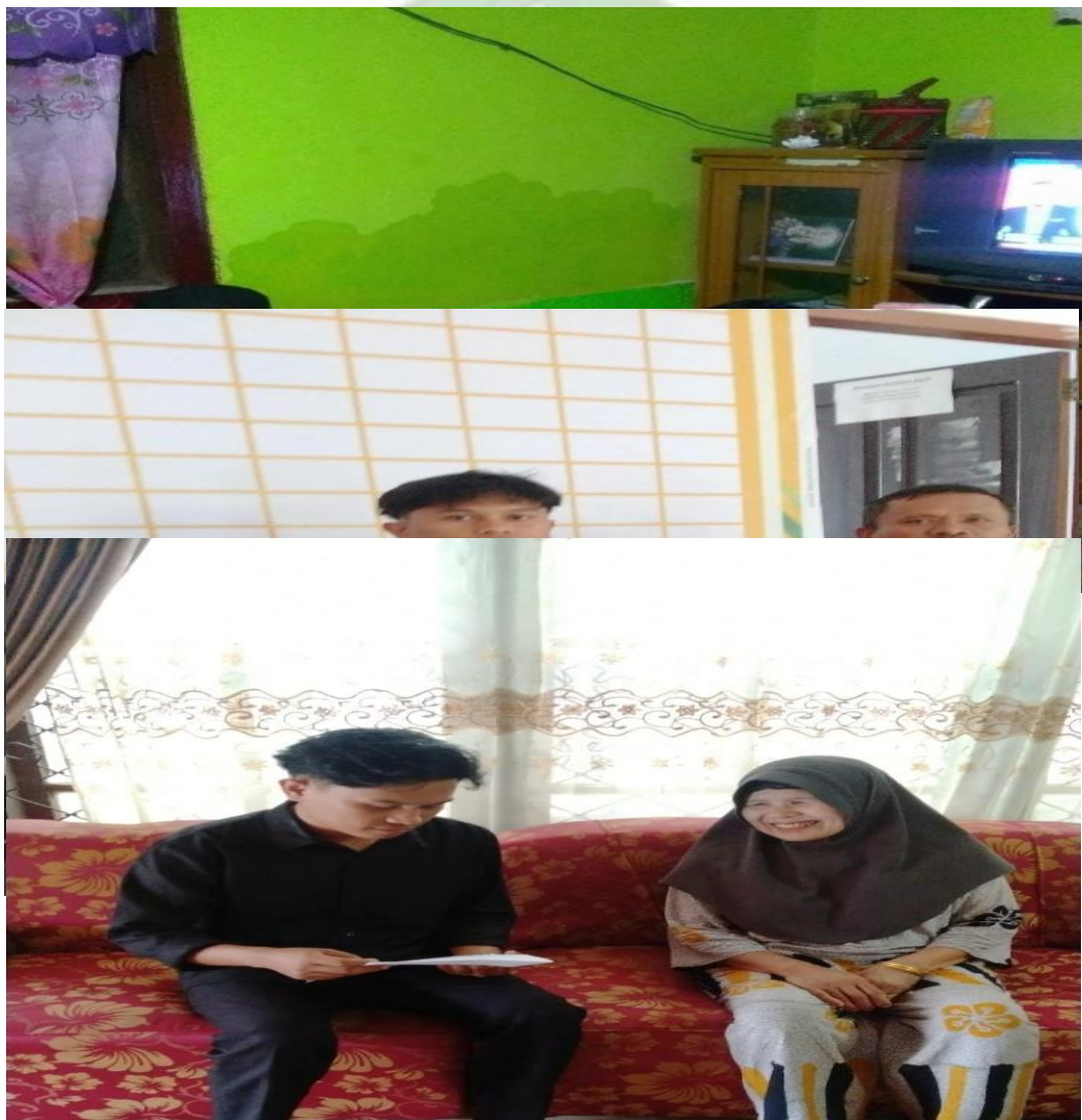
7.Kepala Desa Renah Kayu Embun