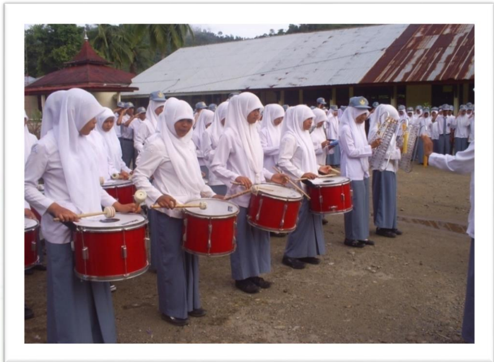
Gambar 11: Drumband dalam pelaksanaan Upacara Bendera

Dari gambar di atas dapat kita lihat bahwa semua siswa sudah siap untuk melaksanakan upacara bendera, mereka sudah membentuk barisan yang rapi. Ini dapat kita buktikan bahwa masing-masing pimpinan barisan sudah melapor kepada pemimpin upacara, bahwa upacara siap dilaksanakan. Begitu juga dengan anggota Drumband sudah siap dengan alat musiknya masing-masing seperti pada gambar berikut: