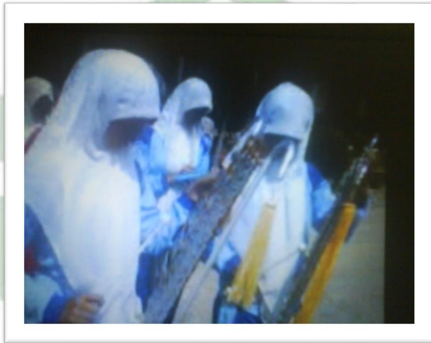
Gambar 6: Latihan alat musik bellira (Dok. Fitrawati, 10 Maret 2024)

Selain mengamati kegiatan latihan perkusi peneliti juga mengamati pelaksanaan latihan alat musik melodi yang berjumlah 13 orang sudah termasuk dengan mayoret, pengamatan ini bertepatan pada hari Sabtu, 10 Maret 2012. Pada proses latihan melodi siswa juga dikumpulkan di lapangan dan guru menunjuk salah satu dari anggota Drumband untuk memimpin doa, setelah itu guru mengabsen siswa. Dalam proses latihan ini guru memberikan penjelasan kepada siswa bahwa bellira alat musik pukul, sedangkan pianika termasuk kepada alat musik tiup, seperti yang terdapat pada gambar berikut: