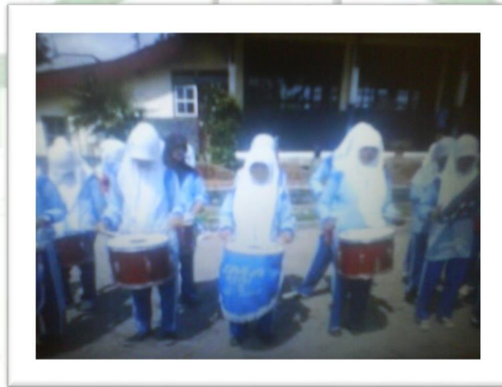
Gambar 9: Latihan untuk persiapan upacara bendera hari senin

Setelah lancar lagu pertama mayoret memberi aba-aba dengan dua jari yang berarti siswa disuruh untuk memainkan lagu kedua, yaitu lagu Mengheningkan Cipta. Menurut pengamatan peneliti pada waktu siswa memainkan lagu Mengheningkan Cipta sudah mulai terlihat bagus karena mereka latihan tampak begitu konsentrasi dan lebih menghayati. Selanjutnya masuk kepada lagu ketiga dan lagu keempat yakni lagu Maju Tak Gentar dan Sorak Sorak Bergembira. Pada lagu urutan ketiga dan keempat ini merupakan lagu yang selalu pemicu semangat siswa setiap latihan. Kegiatan latihan ini dilakukan berulang-ulang agar memperlancar pukulan dan cara memainkan alat musik. Dengan adanya kegiatan latihan berulang-ulang seluruh pemain tampak begitu lincah sehingga bersemangat dalam memainkan alat musik, seperti yang terdapat pada gambar berikut: