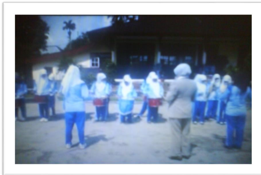
Gambar 8: Latihan Gabungan (Sabtu, 17 Maret 2024)