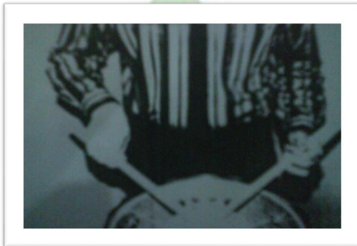
Gambar: 3 Teknik memegang stik dengan tangan kiri dan tangan kanan

Palm angle_ Approximately a 60 degree angle, or slightly less perpendicular to the ground. The hand should maintain this angle when striking the drum. (Kemudian tekukkan ibu jari seakan-akan menekan kebawah dan jari manis menekan ke atas, lalu kita tekuk jari telunjuk dan jari tengah)