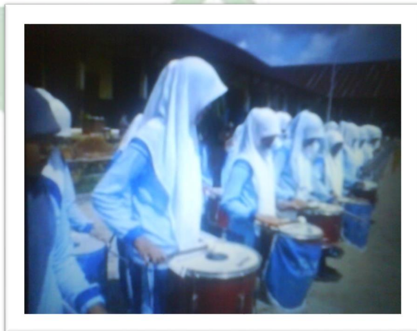
Gambar 5: Latihan alat perkusi (Dok. Fitrawati, 03 Maret 2024)

Dalam pelaksanaan kegiatan latihan ini siswa latihan dengan menggunakan feelings oleh karena itu pelatih memberikan materi tanpa menggunakan partitur dan semua siswa konsentrasi memperhatikan pelatih yang sedang mendemonstrasikan pola irama musik Drumband tersebut. Sebagai umpan balik siswa menanyakan sesuatu yang berhubungan dengan materi dan kemudian siswa meniru atau memperagakan kedalam alat sebagaimana dapat dilihat pada gambar dibawah ini: