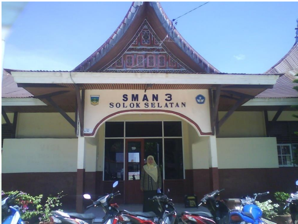
Gambar 4: SMAN 3 Solok Selatan (Dok. Fitrawati, 20 November 2024)

2005 ditunjuk sebagai SMA favorit di Kabupaten Solok Selatan. Tahun 2006 SMAN 3 ditetapkan sebagai penyelenggara kelas unggul Kabupaten Solok Selatan. Dan pada bulan Juli Tahun 2007, SMA ini kembali berubah nama menjadi SMAN 3 Solok Selatan. Tahun 2007 merupakan tahun yang sangat gemilang bagi SMAN 3 Solok Selatan, hal ini ditandai dengan diraihnya prestasi peringkat pertama sekolah terbaik tingkat SLTA se-Kabupaten Solok Selatan.