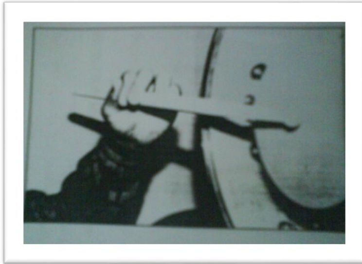
Gambar: 2 Teknik memegang stik dengan tangan kiri

Palm angle_ Approximately a 60 degree angle, or slightly less perpendicular to the ground. The hand should maintain this angle when striking the drum. (Kemudian tekukkan ibu jari seakan-akan menekan kebawah dan jari manis menekan ke atas, lalu kita tekuk jari telunjuk dan jari tengah)