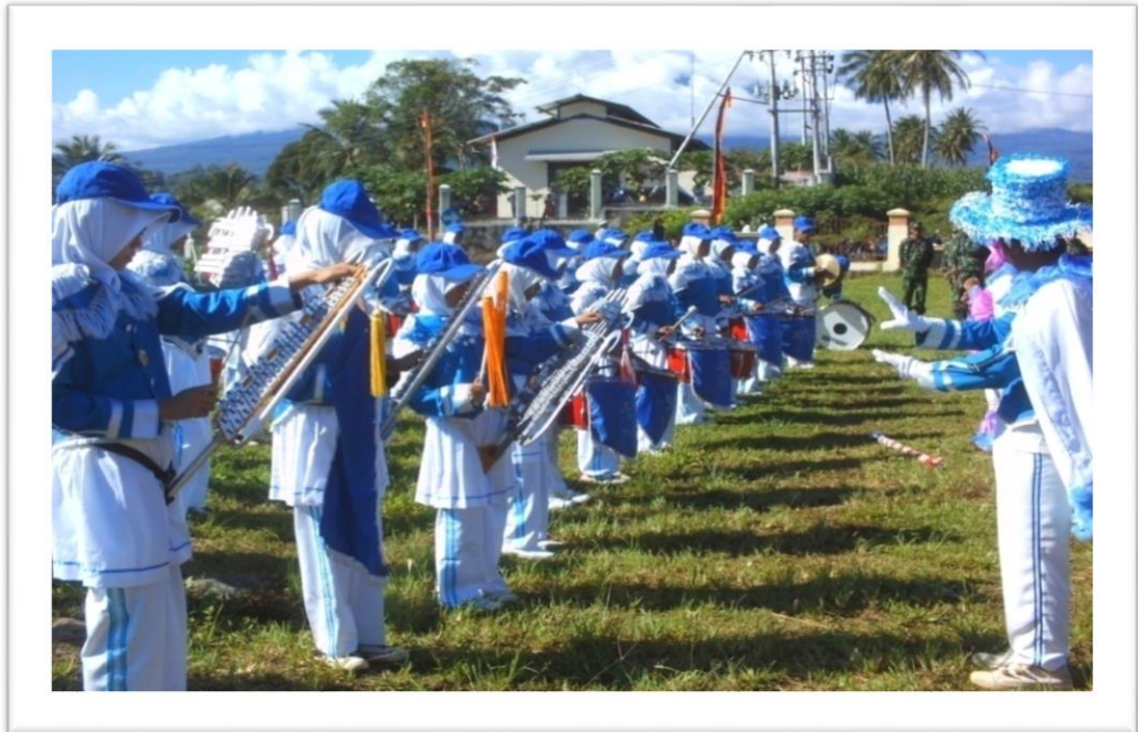
Gambar 12: Upacara Pendidikan Nasional (Dok. Fitrawati, Rabu, 02 Mei 2024)

anggota Drumband bermain dengan hikmat dan penuh konsentrasi. Pertunjukan tersebut dapat dilihat pada gambar berikut: