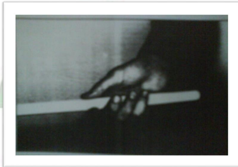
Gambar: 1 Teknik memegang stik dengan tangan kanan

Beberapa teknik memegang stik dalam memainkan alat musik Drumband seperti yang terdapat pada gambar berikut: