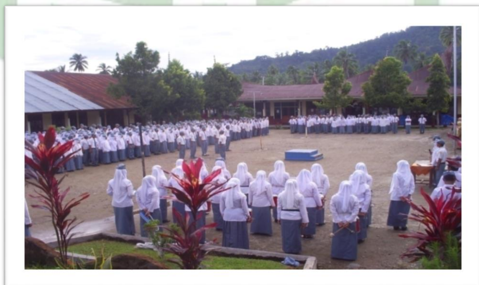
Gambar 10. Upacara Bendera Hari Senin di SMA 3 Solok Selatan

Selain mengamati saat latihan, penulis juga mengamati pemain musik Drumband hari Senin, 23 April 2024. Pelaksanaan Upacara Bendera setiap hari Senin dengan diiringi musik Drumband merupakan rutinitas bagi SMAN 3 Solok Selatan. Rutinitas upacara bendera hari senin dapat dilihat pada gambar berikut: