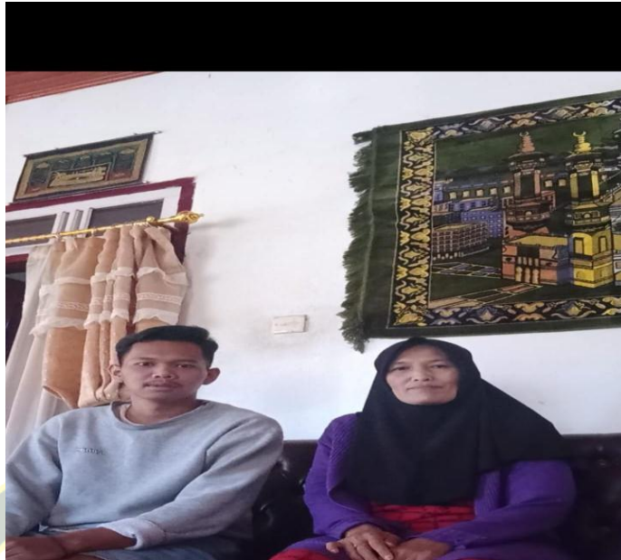
Wawancara dengan Pembeli