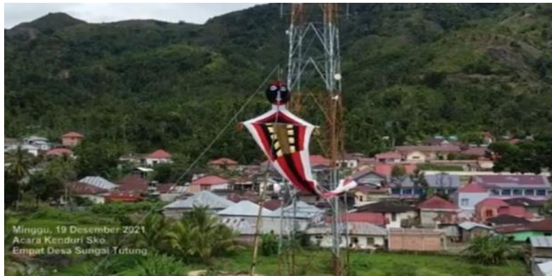
Gambar 1. Karamentang

dan tanggung jawab, hitam yang melambangkan ketenangan dan kuning yang melambangkan keceriaan atau kesenangan dan motif batik ditengah yang berwarna coklat yang melambangkan tentang batik kebudayaan kerinci. karamentang Sungai Tutung juga berbentuk segitiga terbalik panjang dan bergambar kepala manusia di atasnya. Dan memiliki ukuran 3-5 meter.