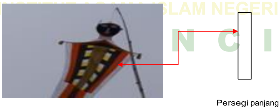
Gambar 2. Bangun Datar yang Bisa di Refleksikan Pada Karamentang Sungai Tutung