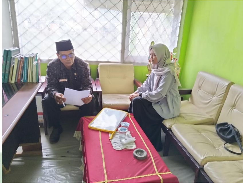
Gambar 1: penyerahan surat izin penelitian dan wawancara pak kepala KUA Kecamatan Air Hangat 15 januari 2025