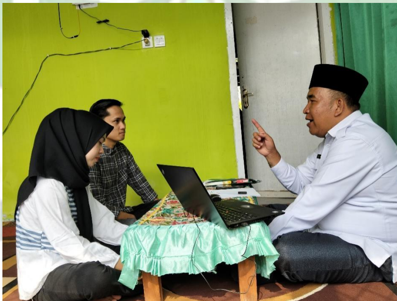
Gambar 4: calon pengantin bimbingan nikah di kau kecamatan air hangat 20