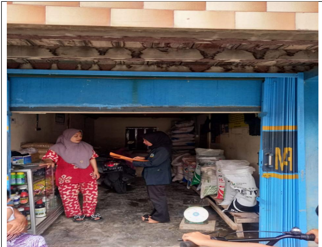
Wawancara dengan Pemilik Kios Pupuk Subsidi