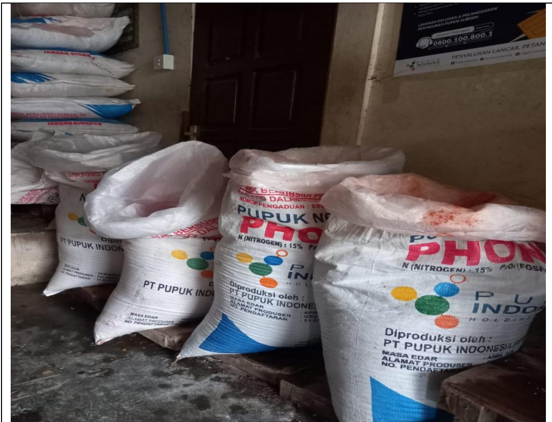
Wawancara dengan Penyuluh Pertanian