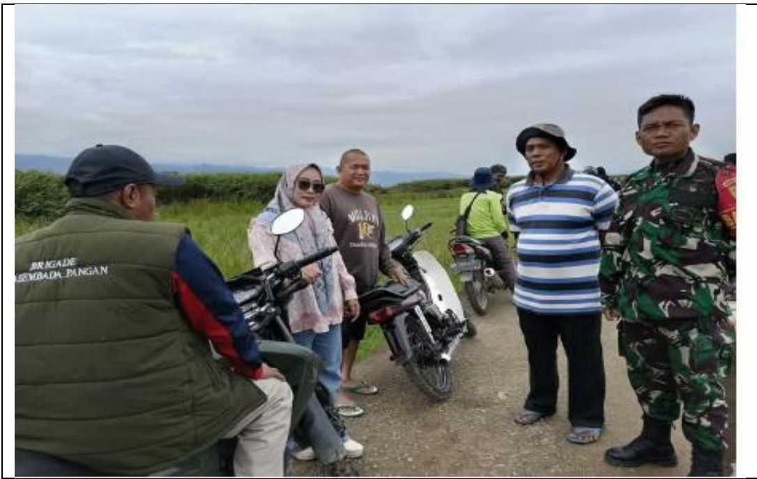
Wawancara dengan Babinsa, Penyuluh Pertanian, dan Ketua Kelompok Tan