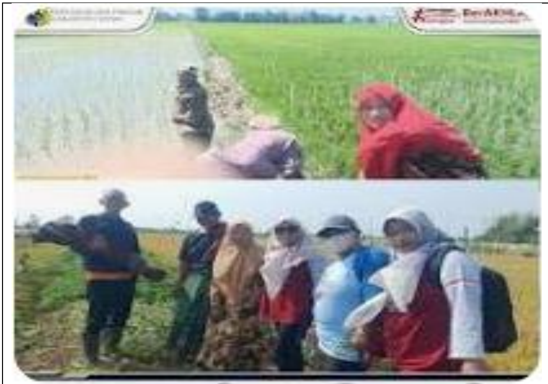
Wawancara dengan Guru BK