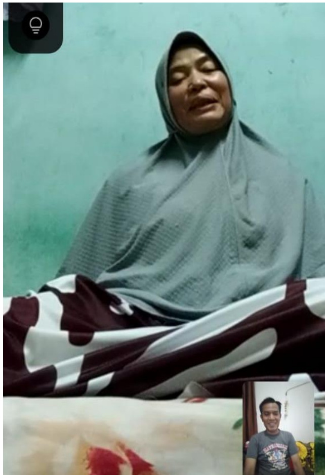
Wawancara Via VideoCall dengan DW Istri yang berangkat ke Malaysia