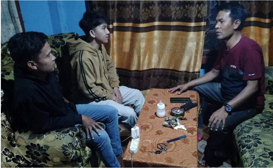
Wawancara dengan SS dan FJ anak dari ibu nya berangkat ke Malaysia