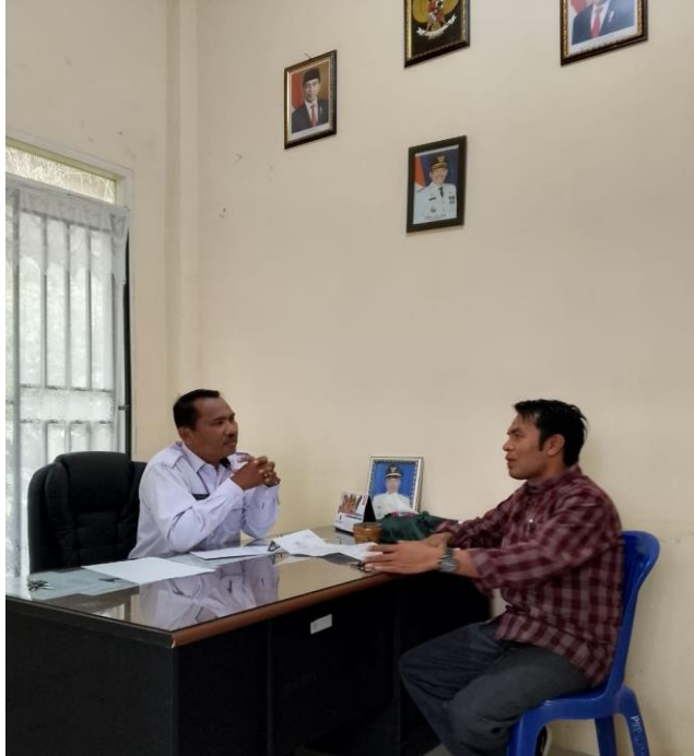
Wawancara dengan Camat Tanah Cogok