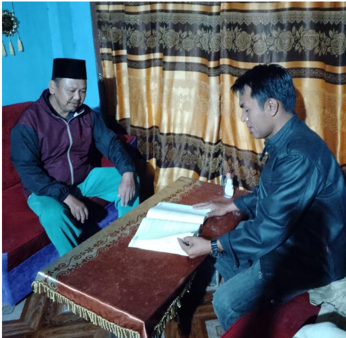
Wawancara dengan MT Suami dari istri yang berangkat ke Malaysia