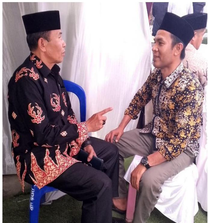
Wawancara dengan Kepala Desa Ujung Pasir