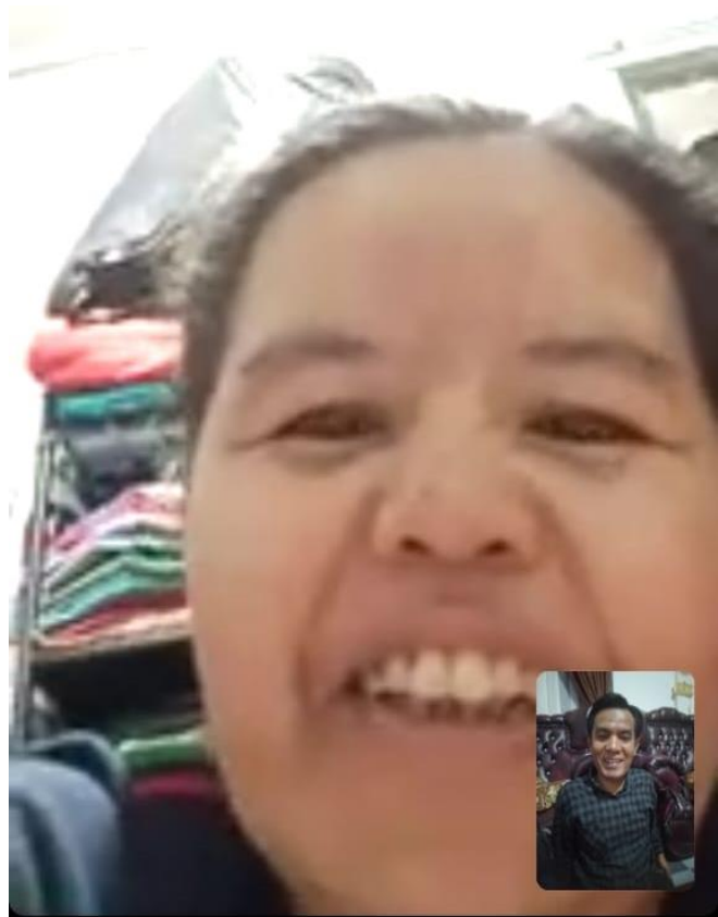
Wawancara Via Videocall dengan SP Istri yang berangkat ke Malaysia