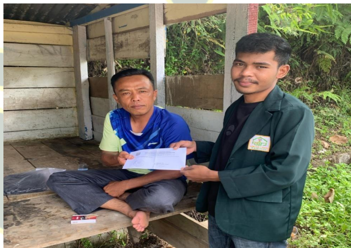
10 Maret 2025 (Nasabah Bapak Can)