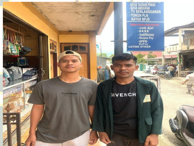
19 Maret 2025 (Agen Bapak Riki)