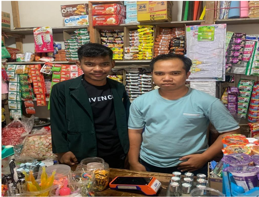
19 Maret 2025 (Agen Bapak Jefri)