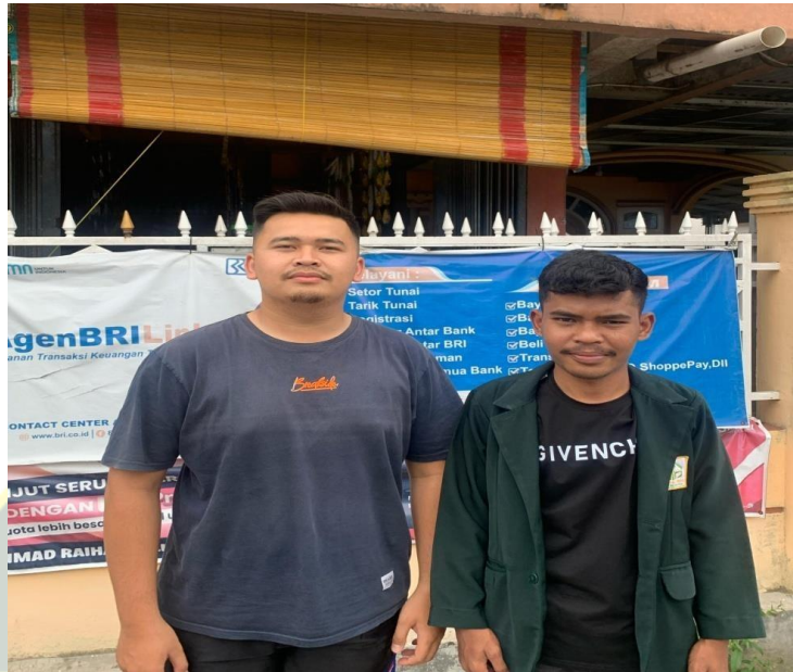
05 Maret 2025 (Agen Bapak Ahmad Raihan)