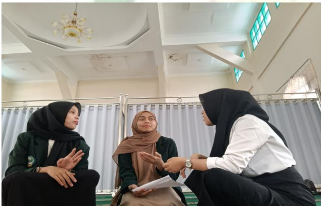
Wawancara Dengan NO & RL