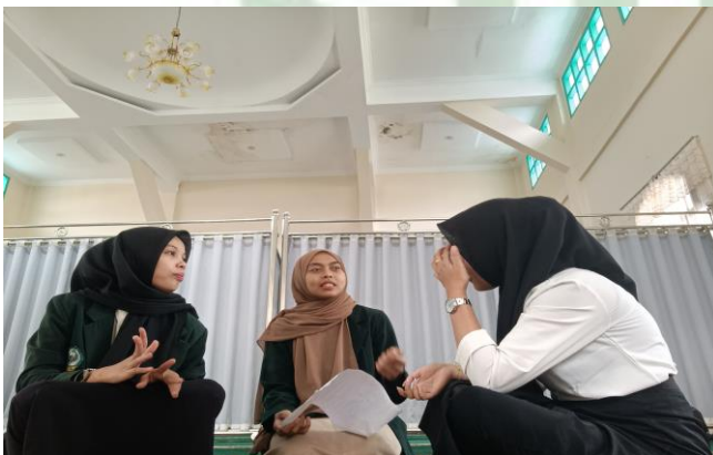
Wawancara Dengan NO &