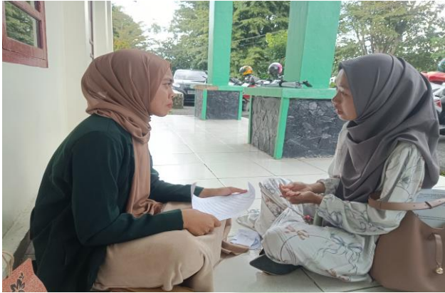
Wawancara Dengan SS