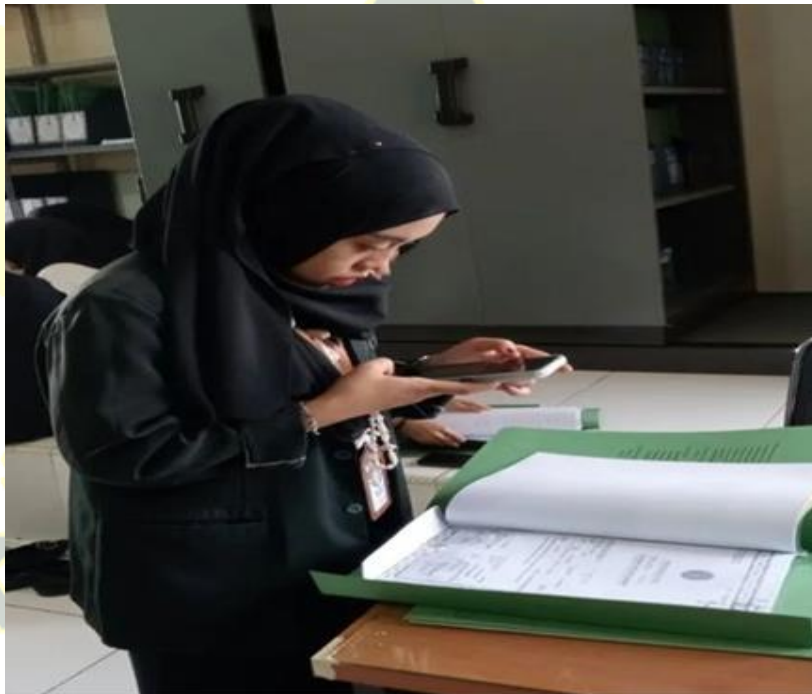
GAMBAR 2: BERKAS PUTUSAN