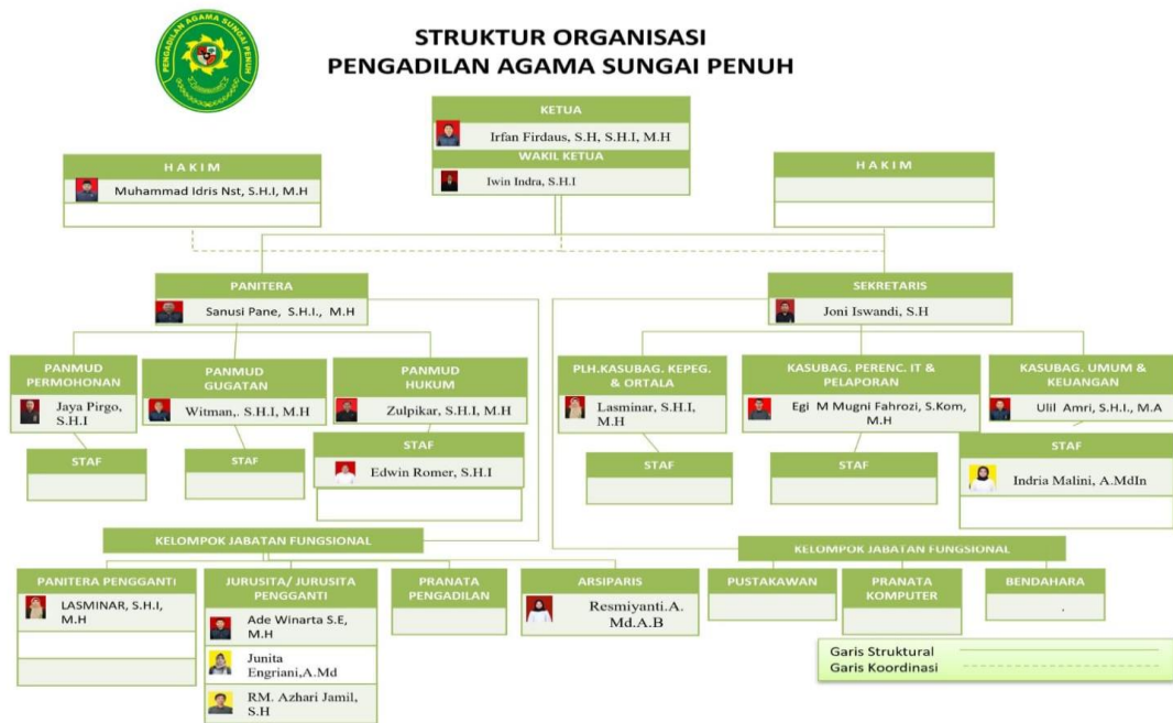
GAMBAR 3: STRUKTUR ORGANISASI PENGADILAN AGAMA SUNGAI PENUH