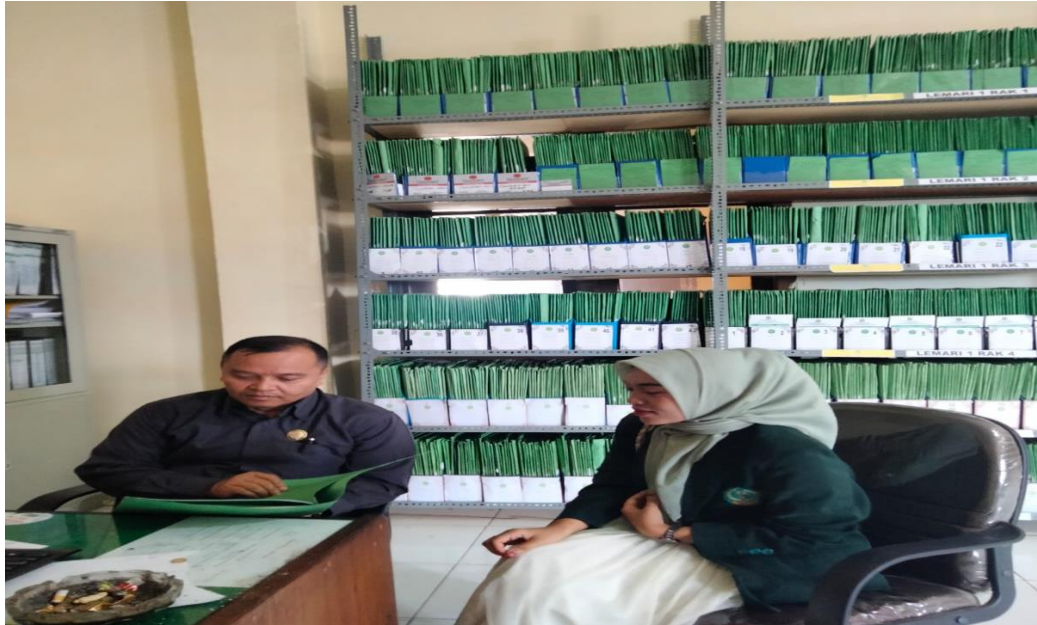
GAMBAR 1: WAWANCARA BERSAMA PANITERA PENGADILAN AGAMA SUNGAI PENUH