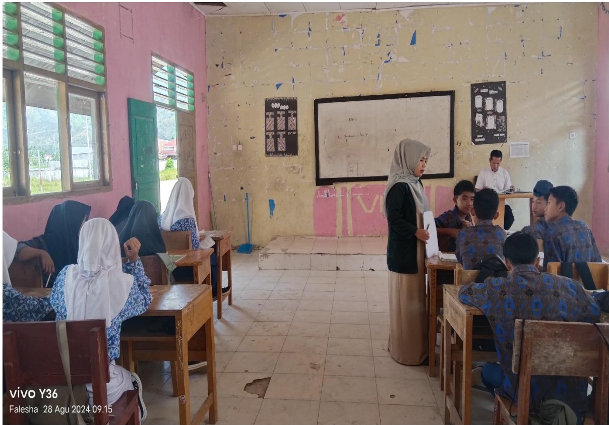
vivo Y36 Falesha 28 Agu 2024 09:15