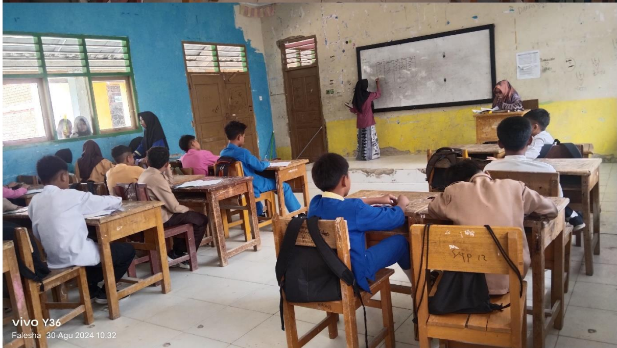
vivo Y36 Falesha 30 Agu 2024 10:32