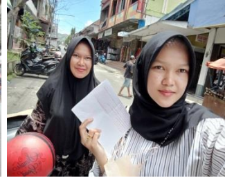
Yolan, Baru Sungai Deras