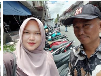
Endepi, Sungai Tutung