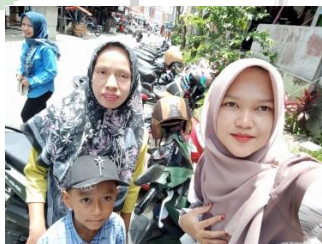
Hermanita, Koto Lolo