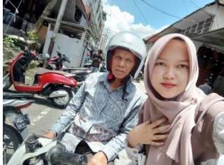
Zamzami, Lubuk Suli