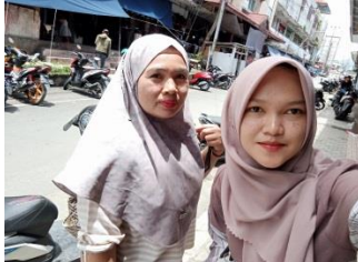
Ayu, Tanah Kampung