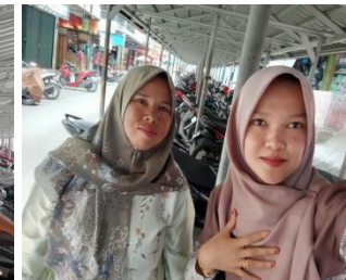
Asmanita, Sungai Abu