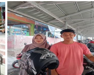
Rendi, Pulau Sangkar