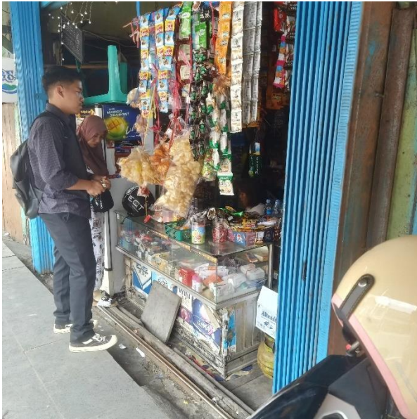
Wawancara dengan pelaku usaha kedai