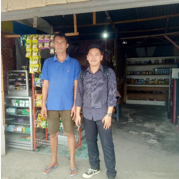
Wawancara dengan pelaku usaha warung ara