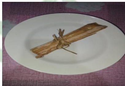
Gambar 4. Daun Pinang

Daun pinang, atau yang dikenal dengan nama latin Areca catechu , sering kali dianggap sebagai limbah dalam ekosistem pertanian. Namun, masyarakat Desa Tebing-Tinggi beranggapan bahwa daun ini memiliki potensi manfaat yang signifikan bagi tanaman padi jika diproses dan dimanfaatkan dengan baik.