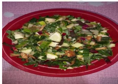
Gambar 8. Obat Padi

Selain itu praktik membaca surat Yasin juga dapat dijadikan upaya untuk memperkuat iman terhadap kekuasaan Allah SWT, surat Yasin sering disebut sebagai jantung Al-Qur'an, yang mengingatkan manusia akan kekuasaan-Nya atas alam semesta ini. Hal ini menumbuhkan kesadaran bahwa tanaman, hujan, kesuburan, dan hasil panen adalah semua atas kehendak-Nya (Chodjim, 2008). Bahan-bahan tersebut dipotong menjadi kecil-kecil agar lebih mudah ditaburkan di lahan persawahan. Berikut adalah dokumentasi bahan-bahan yang telah disiapkan untuk melanjutkan ke proses selanjutnya.