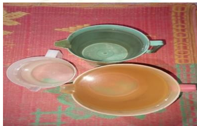
Gambar 7. Air Surat Yasin

Surat Yasin dalam Islam dianggap memiliki banyak keutamaan dan keberkahan. Di Desa Tebing-Tinggi, masyarakat percaya bahwa membaca Al-Qur'an, termasuk surat Yasin , dapat membawa manfaat dalam hal spiritual dan keberkahan, meskipun tidak ada dalil khusus bahwa surat Yasin dapat digunakan sebagai obat untuk tanaman seperti padi.