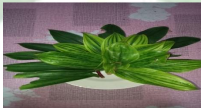
Gambar 1. Daun Sitawa

Daun sitawa dan daun sedingin adalah dua jenis tanaman yang sering digunakan dalam pengobatan tradisional, terutama dalam budidaya padi. Di Desa Tebing-Tinggi, masyarakat melihat kedua daun ini sebagai hal yang tak terpisahkan dan memiliki makna penting. Dalam setiap acara adat istiadat daun-daun ini selalu dilibatkan hal ini menunjukkan peran penting mereka dan masing-masing daun memiliki fungsi spesifik untuk tanaman padi.