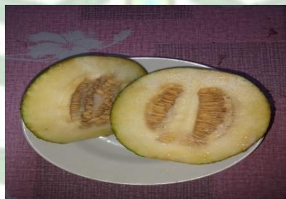
Gambar 5. Buah Kundur

Buah kundur, atau dalam bahasa latin disebut dengan Benincasa hispida , adalah jenis labu-labuan dengan kulit hijau muda dan tekstur keras. Buah ini kaya akan air dan memiliki banyak manfaat, terutama untuk pertanian. Dalam pengobatan tanaman padi, semua bagian buah dapat dimanfaatkan, kulit dan dagingnya yang tidak terpakai bisa diolah menjadi kompos, meningkatkan kesuburan tanah dengan nutrisi seperti nitrogen, fosfor, dan kalium. Selain itu,