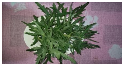
Gambar 2. Daun Sedingin

Daun sitawa, atau Costus Speciosus , adalah tanaman dengan daun lonjong dan bulu halus di permukaan daun dan batangnya. Tanaman ini bisa dijumpai diperkarangan rumah, karena biasanya masyarakat menanam tanaman ini untuk menghiasi perkarangan rumah mereka daun sitawa berfungsi sebagai tonik, memperkuat pertahanan tanaman, dan membantu pemulihan padi yang terkena hama atau penyakit. Selain itu, daun ini mengandung senyawa yang bisa mengurangi kerusakan jaringan tanaman yang disebabkan oleh patogen (Nazmi, 2019).