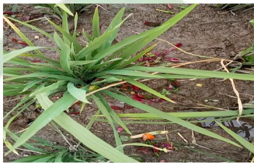
Gambar 9. Obat Padi yang telah dihamburkan

untuk digunakan di lahan persawahan mereka. Obat padi yang telah melalui ritual yasinan ini bisa langsung digunakan pada hari yang sama, atau pada hari-hari berikutnya. Namun, penting untuk segera meletakkannya di lahan persawahan, karena obat padi ini dapat cepat membusuk setelah tercampur dengan air. Selanjutnya, prosesi penyebaran atau penggunaan obat padi ini dilakukan secara merata di lahan persawahan.