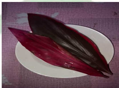
Gambar 3. Daun Hanjuan Merah

Daun hanjuan merah, atau Cordyline fruticosa , adalah tanaman yang tumbuh di lahan basah dengan daun berwarna merah dan batang yang mudah berakar. Tanaman ini memiliki banyak manfaat, terutama untuk ekosistem dan tanaman padi. Pertama, daun hanjuan dapat dijadikan pupuk organik yang meningkatkan kesuburan tanah dan menyediakan nutrisi untuk tanaman padi. Kedua, daun ini dapat mengendalikan gulma dengan berfungsi sebagai mulsa, mengurangi persaingan antara padi dan gulma. Ketiga, daun yang dicampur ke dalam tanah dapat meningkatkan kemampuan tanah untuk menahan air dan mendukung mikroorganisme.