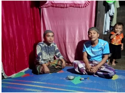
Dokumentasi Obat Padi