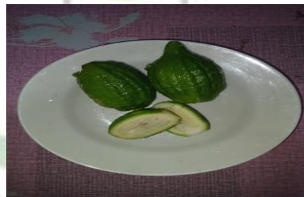
Gambar 6. Jeruk Padang

Jeruk padang, atau jeruk nipis, adalah tanaman yang tumbuh baik di daerah tropis seperti Indonesia dan beberapa negara di Asia Tenggara. Buahnya bulat dengan sedikit oval di ujung, berwarna hijau kekuningan, dan memiliki biji kecil di dalam dagingnya. Aroma yang dihasilkan segar dan khas, berasal dari minyak esensial di kulitnya.