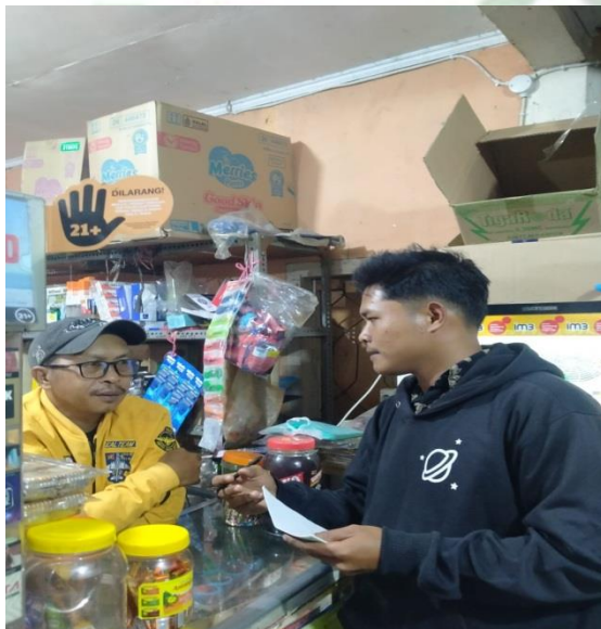
Gambar 4. Wawancara NB (Penjual)