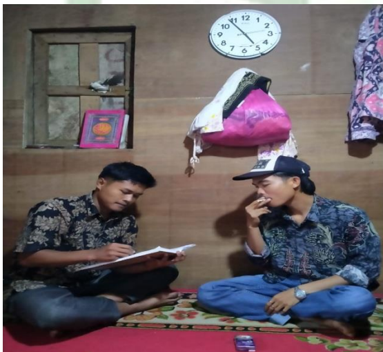
Gambar 2. Wawancara MR (Perokok/Pembeli)