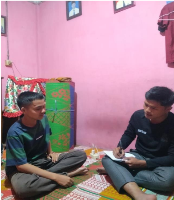
Gambar 3. Wawancara M.H (Perokok/Pembeli)