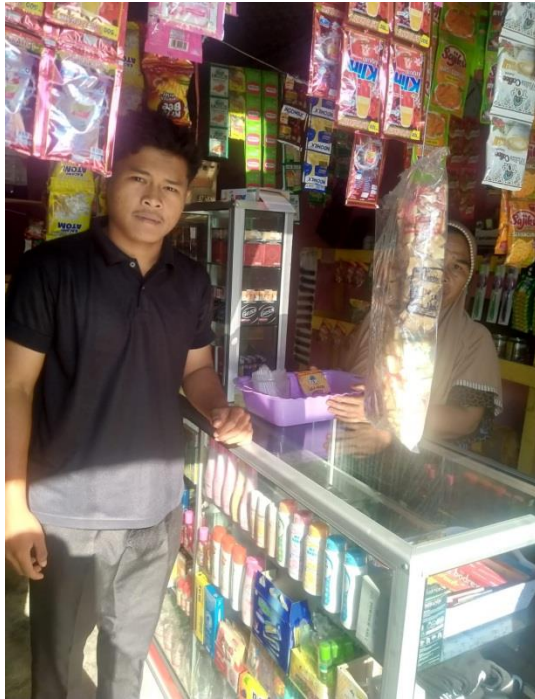
Gambar 5. Wawancara NP (Penjual)