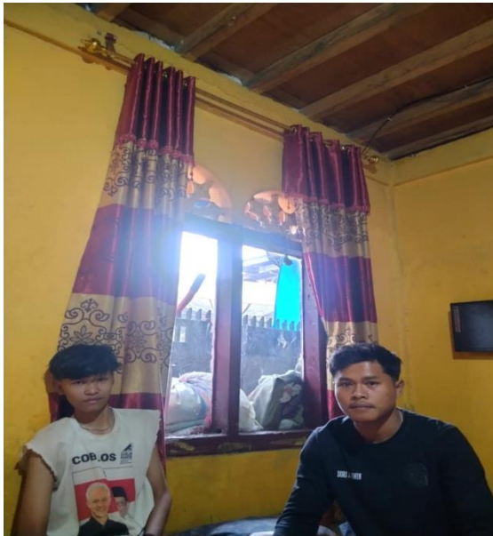
Gambar 1. Wawancara AS (Perokok/Pembeli)