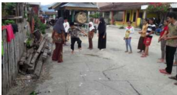
Gambar 3. Permainan ingkek-ingkek di Koto Tengah

Setelah kegiatan ini dilaksanakan diperoleh beberapa temuan sebagai berikut: