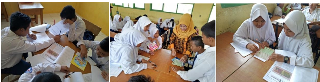
Gambar 2. Proses Pembelajaran

Setelah tahap pengembangan dengan uji coba perorangan dan uji coba kelompok maka tahap selanjutnya yaitu peneliti melakukan penerapan LKPD matematika berbasis budaya Jambi pada kelas sesungguhnya atau proses implementasi. Menurut Branch (2009: 133) pada tahap implementasi produk yang telah diujicobakan diterapkan dalam situasi nyata dengan pengajaran yang sesungguhnya dengan menggunakan LKPD berbasis budaya Jambi. Pemakaian LKPD ini dilakukan pada siswa kelas VII F SMP N 22 Kota Jambi.