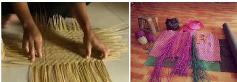
Gambar 1. Kerajinan Jambi (Anyaman)

Menurut Munandar (Ngalimun, 2013:47) kreativitas adalah kemampuan untuk membuat kombinasi baru, berdasarkan data, informasi, atau unsur-unsur yang ada. Jadi LKPD berbasis budaya ini adalah hal baru bagi siswa yang akan membuat siswa antusias untuk mengerjakan LKPD yang dirancang dan dikembangkan oleh guru. Berdasarkan uraian diatas, maka peneliti tertarik untuk melakukan penelitian dan pengembangan dengan fokus “Mengembangkan Lembar Kerja Peserta Didik (LKPD) pada Materi Geometri Berbasis Budaya Jambi untuk Meningkatkan Kreativitas Siswa SMP”